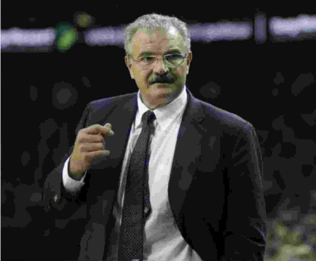
Meo Sacchetti Classe '53, è stato anche Ct della nazionale italiana dal 2017 al 2022